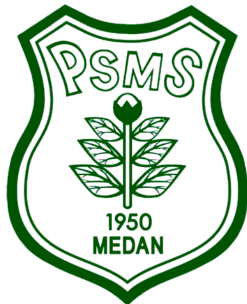
Logo PT Kinantan Medan