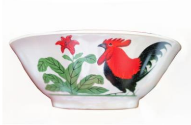
Logo Ayam Pada Mangkok

PT Sri Intan Toki Industri sebelum pihaknya mengajukan gugatan ke Pengadilan dan melaporkannya ke Direktorat Jendral Kekayaan Intelektual.