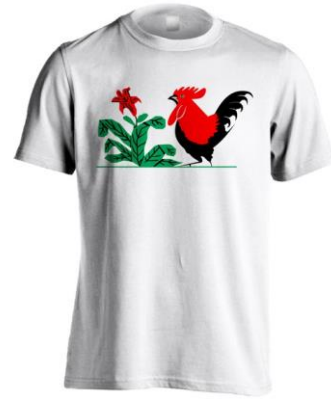
Logo Ayam Pada Baju