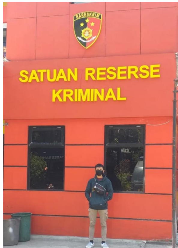
Mengunjungi Gedung Satuan Reserse Kriminal