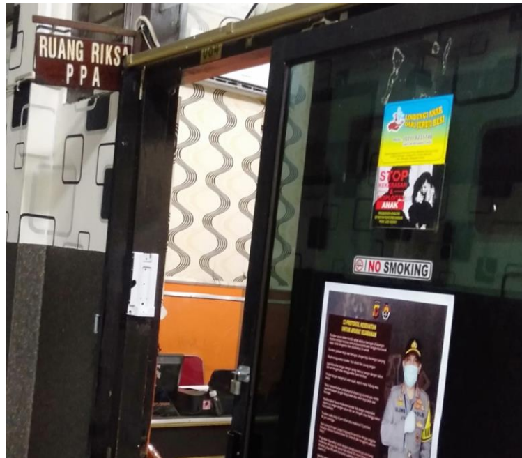
Mengunjungi Ruang Kerja Unit PPA Polrestabes Bandung untuk meminta data Tanggal 9 September 2020