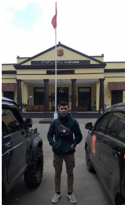
Pertama kali melakukan observasi di Polrestabes Bandung