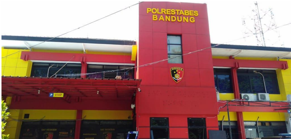
Gedung Satuan Reserse Kriminal