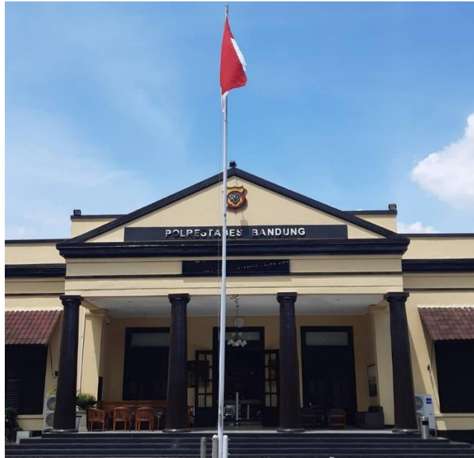
Gedung Polrestabes Bandung