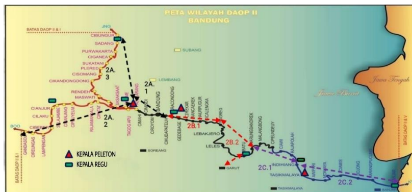
Gambar 4.1 Peta Geografis Wilayah Daop 2 Bandung

Kantor Daop berada di wilayah kelurahan babakan ciamis, Jl. Stasiun Selatan No. 25 Bandung, Kecamatan Sumur Bandung, Kota Bandung, Provinsi Jawa Barat, kode pos 40181. Stasiun tertinggi berada di nagreg dengan tinggi +848 m, dan di lebak jero dengan tinggi +818 m.