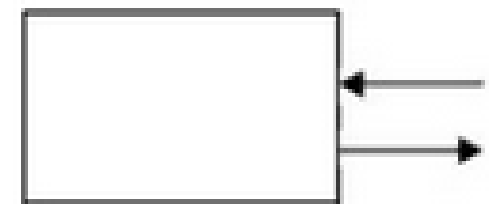
terminator tujuan dan sumber