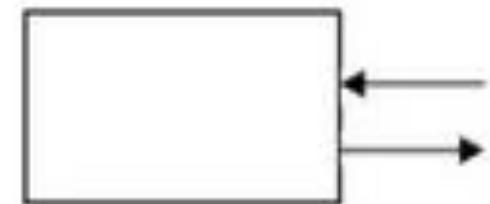
terminator tujuan dan sumber